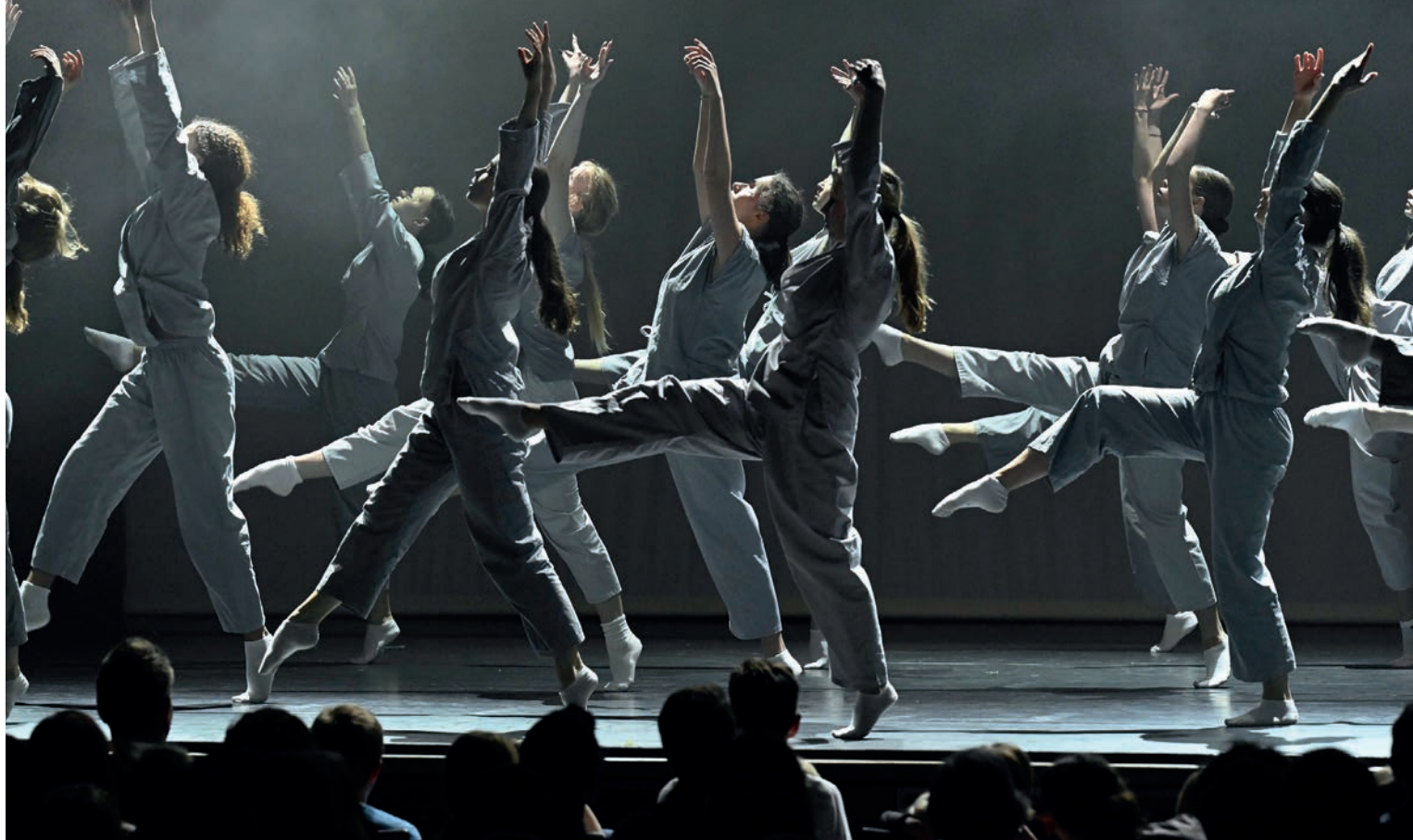
Iwanson Youngsters, Gewinner des Unterföhringer Publikumspreises 2023.