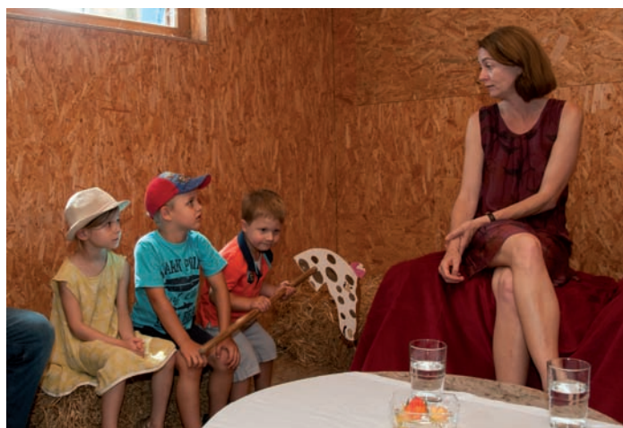
Katarina Barley; Auch ein Ohr für die ganz Kleinen.